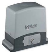
ACE 600ET / ACE 800E